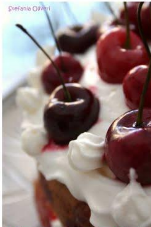
Chiffon cake con ciliegie