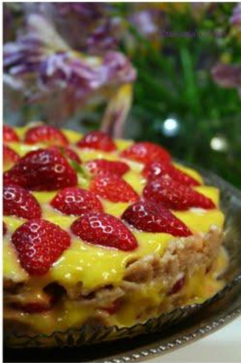
Torta con corn flakes e lemon curd