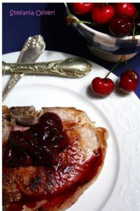
Bracirole di maiale alle ciliegie

1 tazza di ciliegie, snocciolate 3 cucchiaini di acqua 1 / 4 tazza di vino rosso secco 2 cucchiaini di aceto di vino rosso 2 cucchiaini di miele di acacia 1 cucchiaino di foglie di timo tritato 1/2 cucchiaino di senape secca