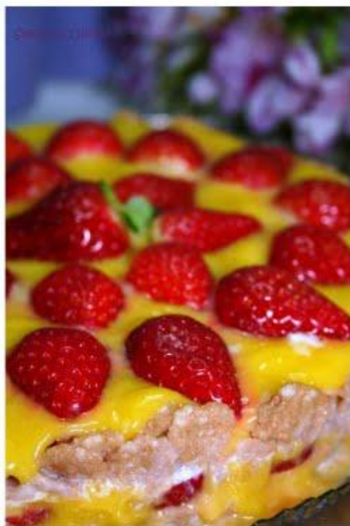
Torta con corn flakes e lemon curd

L'idea parte dall'enciclopedia di dei dolci del Corriere della Sera, volume 16. Però, a parte le mie modifiche, devo segnalare che le dosi, almeno per i miei corn flakes, che giocoforza sono dietoterapici, sono diverse. Io vi metto quindi le mie dosi sperimentate!