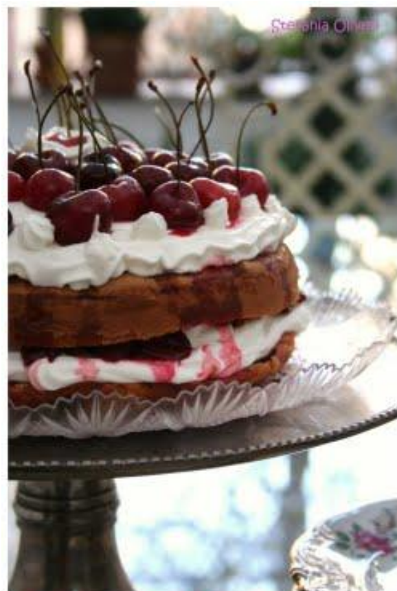
Chiffon cake con ciliegie

Ingredienti per la base plumcake al caramello: